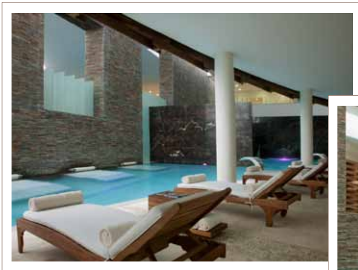
Grand Velas, Riviera Maya