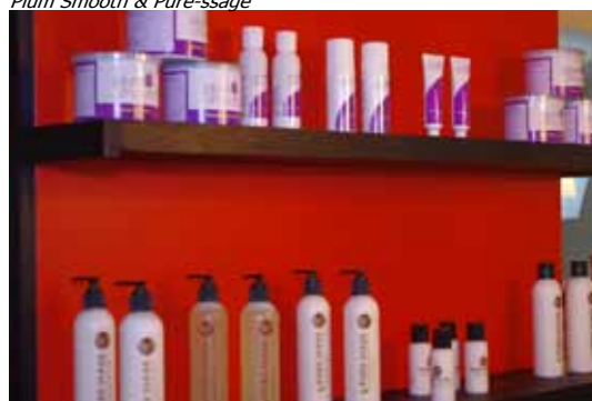
Plum Smooth & Pure-ssage