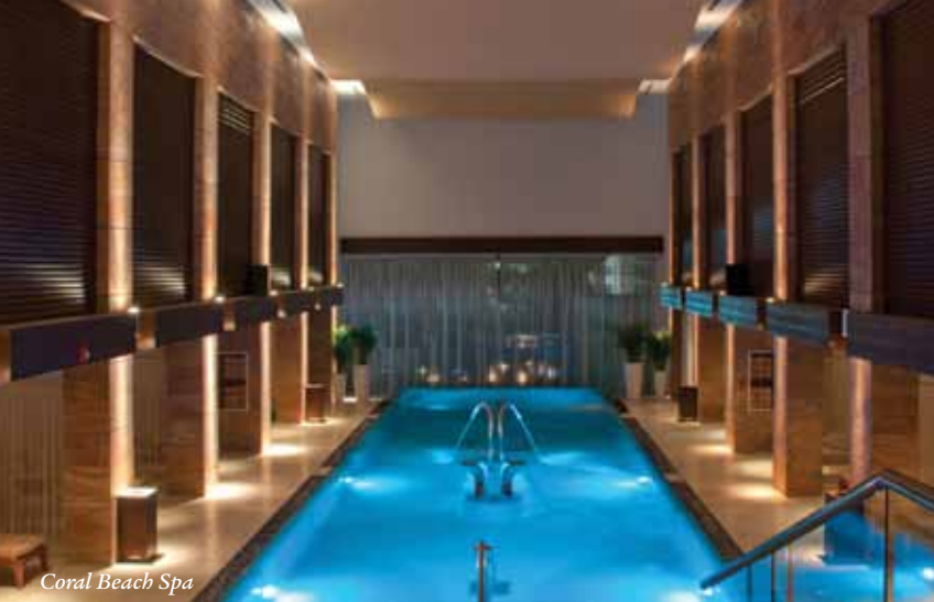
Coral Beach Spa