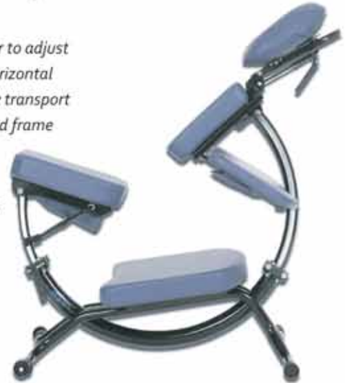
The Innovative Dolphin II™ Massage Chair

707 829 1496 • 800 822 5333 info@piscespro.com • www.piscespro.com