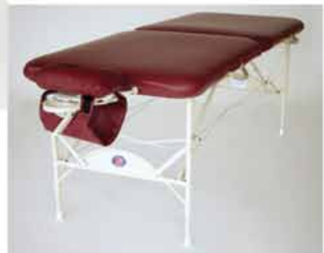
The New Wave II Lite™ Massage Table

Enhances bodywork treatments, stretching, weight lifting or to relieve compressed vertebrae or nerves.