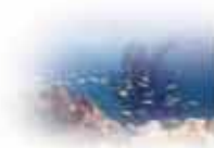
LA EXPERIENCIA MARINA