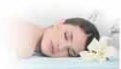
EL SUMMUM DEL RELAX