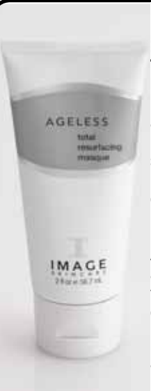
Image Skincare, Ageless Total Resurfacing Masque

Una mezcla exfoliante de ácidos glicólico y salicílico resurgir de la piel, descamación suavemente las células muertas, con un complejo de aclarar para disminuir las manchas marrones.